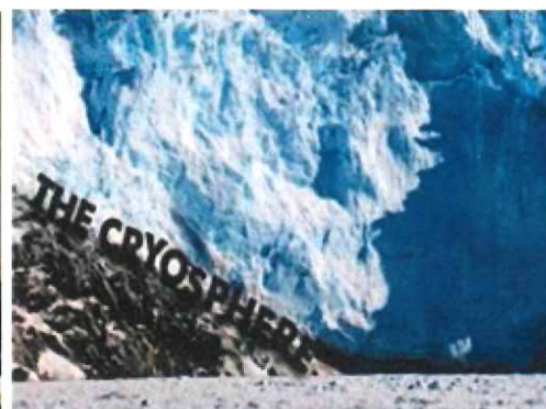
和紙と障子紙のノリが乾く間に地球温暖化について学びます。二酸化炭素を使った実験もあります。