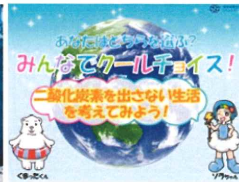
しっかり、お勉強した後にクールチョイスクイズ。 簡単にそうで、難しいクイズで復習です。