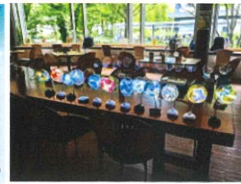
できれば、どれも100点満点。個性が出る作品ばかり。セミナー満足度100%が自慢です